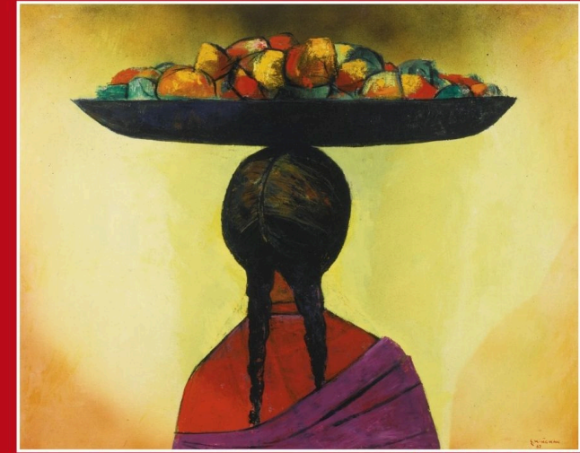
Eduardo Kingman, Frutera, 1967

Des nourritures terrestres en Équateur : aliments, pratiques alimentaires et identité(s)